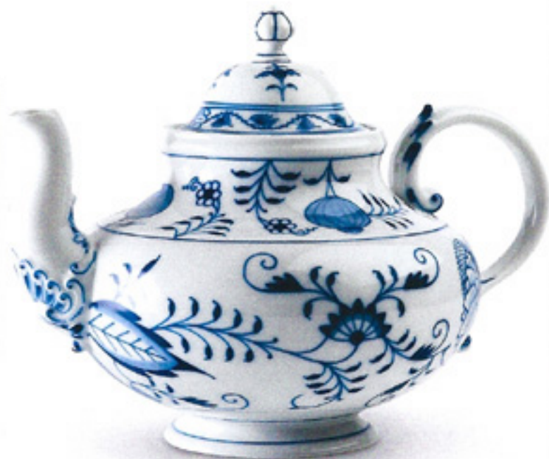
MEISSENER TEEKANNE. Im Zwiebelmuster-Dekor. Fr. 790.- → Porzellengeschäft am Grossmünster, Oberdorfstr. 25, Zürich, 044 262 15 66

THE CLEAR BOX sorgt für Klarsicht in der Schuhsammlung. Die bunten, durchsichtigen Schuhschachteln für jede Art von Trettern bestehen aus umweltfreundlichem Polypropylen. Es gibt sie für Stiefel, Stiefeletten, Pumps, Ballerinas, Loafers, Flipflops und was sonst das Sammlerinnenherz begehrt. Clear Boxes sorgen übrigens nicht nur bei Schuhliebhaberinnen für Klarheit, sondern auch bei Pullover-, Hut-, oder T-Shirt-Sammlerinnen. Und ihren männlichen Gegenstücken. Auf www.theclearbox.com können alle Modelle direkt bestellt werden, z.B. ein 10er-Set Ladies' clear box für Fr. 79.90. → The Clear Box/Saxess GmbH , Baarerstr. 43, Zug, www.theclearbox.com